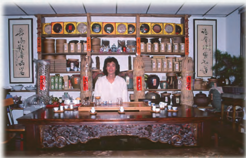
▲ 何會長 / 行家內景