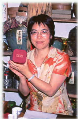
▲ 首次突破，贈獎「不老丹」