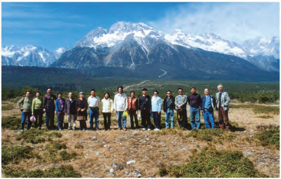
▲ 雲南玉龍雪山前合影