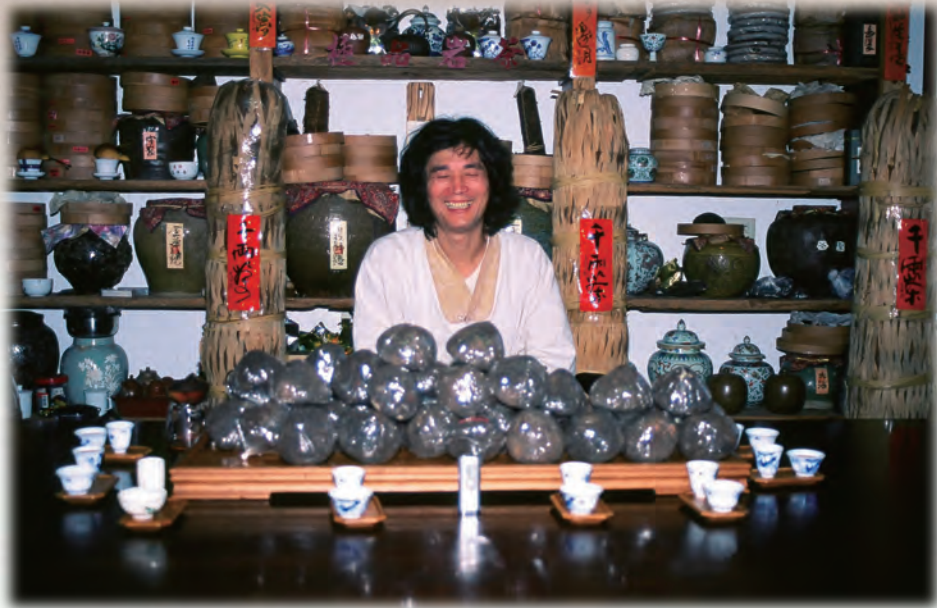
▲ 分享可以擁有更多·滿盤盡是末代緊。