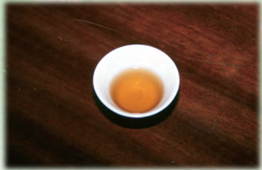
▼ 金瓜貢第三杯湯色