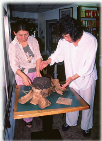
何會長夫婦合開筒裝「萬鴻記」（四餅）▶